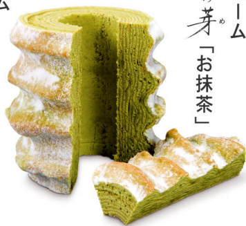
マウントバウム 和菓子の芽「お抹茶」