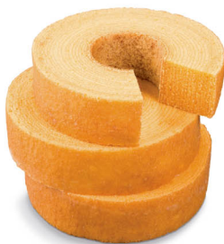
ストレートバウム 和菓子の芽「ゆず」

年輪に芽吹いた 和菓子のおいしさ もうひとつの「ねんりん家」の世界を お楽しみください。